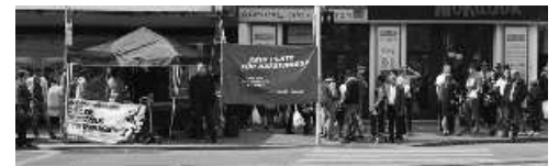
Blaues Fest der FPÖ? Ein lautes Nein!